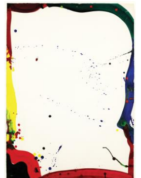
is To Mako, ca. 1966, Acryl auf Papier, 104,1 x 74,9 cm.

In den 1960er Jahren spielt Acrylfarbe eine große Rolle in seinem Schaffen, wie bei Ohne Titel, 1964, Acryl auf Papier, 90,2 x 62,9 cm. Pinselstriche sammeln sich in großen und kleinen Farbfeldern, die stets in einer harmonischen Beziehung zueinander stehen. Der kraftvolle expressive Farbauftrag bei is To Mako, ca. 1966, Acryl auf Papier, 104,1 x 74,9 cm ist ein Beispiel für die ausdrucksstarke Malerei am Rand des Werkes sowie für die feinen Farbspritzer und Tropfen, die Francis' Arbeiten so charakteristisch werden lassen. Dieser Eindruck des Action Paintings setzt sich auch in den kommenden Jahrzehnten in Francis' künstlerischem Schaffens weiter fort. Die typischen Farbinseln und Rinnsale, als auch die flächendeckende Farbstruktur der 1970er Jahre findet sich in einem ganz besonderen Highlight der Ausstellung wieder. Die über 3 Meter große Arbeit E V, 1970 – 71, Acryl auf Leinwand, 304,8 x 182,9 cm besticht durch ihre gekonnte Verschmelzung der weißen Leinwand mit dem zarten Vexierspiel der lasierenden Acrylfarben.