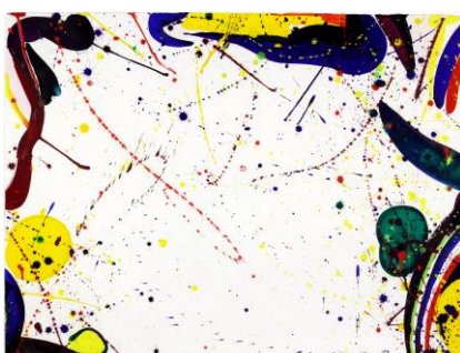
Ohne Titel, 1964, Acryl auf Papier, 90,2 x 62,9 cm.

Sam Francis zeigt sich sein Leben lang nicht nur vom Einsatz der Primärfarben in Monets Werk und vom amerikanischen Expressionismus von Jackson Pollock beeinflusst, sondern seine Werke sind Anknüpfungspunkte an die fernöstliche, insbesondere japanische Kultur. Seine Aufenthalte in Paris und anderen europäischen Städten sowie zwei Weltreisen, die ihn bis Thailand, Indien und Tokio führen, nutzt er zu eingehenden Studien, die beeindruckende Arbeiten hervorbringen. Dabei lautet die Botschaft, die Sam Francis mit seinen Werken ausdrückt: „We are always at the Center of Space.“