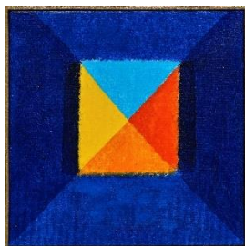
Heinz Mack, Chromatische Konstellation, »Ohne Titel«, 2018/2019, signiert, Acryl auf Leinwand, 45 x 45 cm Sonderverkaufspreis: 43.000 €

An diesem Abend werden drei Kunstwerke offeriert, die Sie auf unserer Website ab sofort anschauen können. Der Erlös aus dem Verkauf dieser drei Kunstwerke wird von der Veranstalterin zu 70% an die Stiftung Deutsche Schlaganfall-Hilfe gespendet.