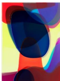
Peter Zimmermann, »o«, 2020, signiert, Epoxid auf Leinwand, 60 x 45 cm Sonderverkaufspreis: 14.000 €