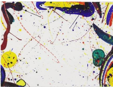
Untitled (#2 Pri-Rain) (SF64-592), 1964, Gouache auf Papier, 57,2 x 75,6 cm.

Die Ausstellung im Hotel Sacher umfasst 12 Silberexponate höchster Qualität . Begleitet wird die exklusive Präsentation von wichtigen Originalen berühmter Künstler wie Fernando Botero, Sam Francis, Hans Hartung, Alexej von Jawlensky, Ernst Ludwig Kirchner, Max Liebermann, Heinz Mack, Gabriele Münter, Emil Nolde, Gerhard Richter, Christian Rohlfs, Leser Ury und Alfons Walde.