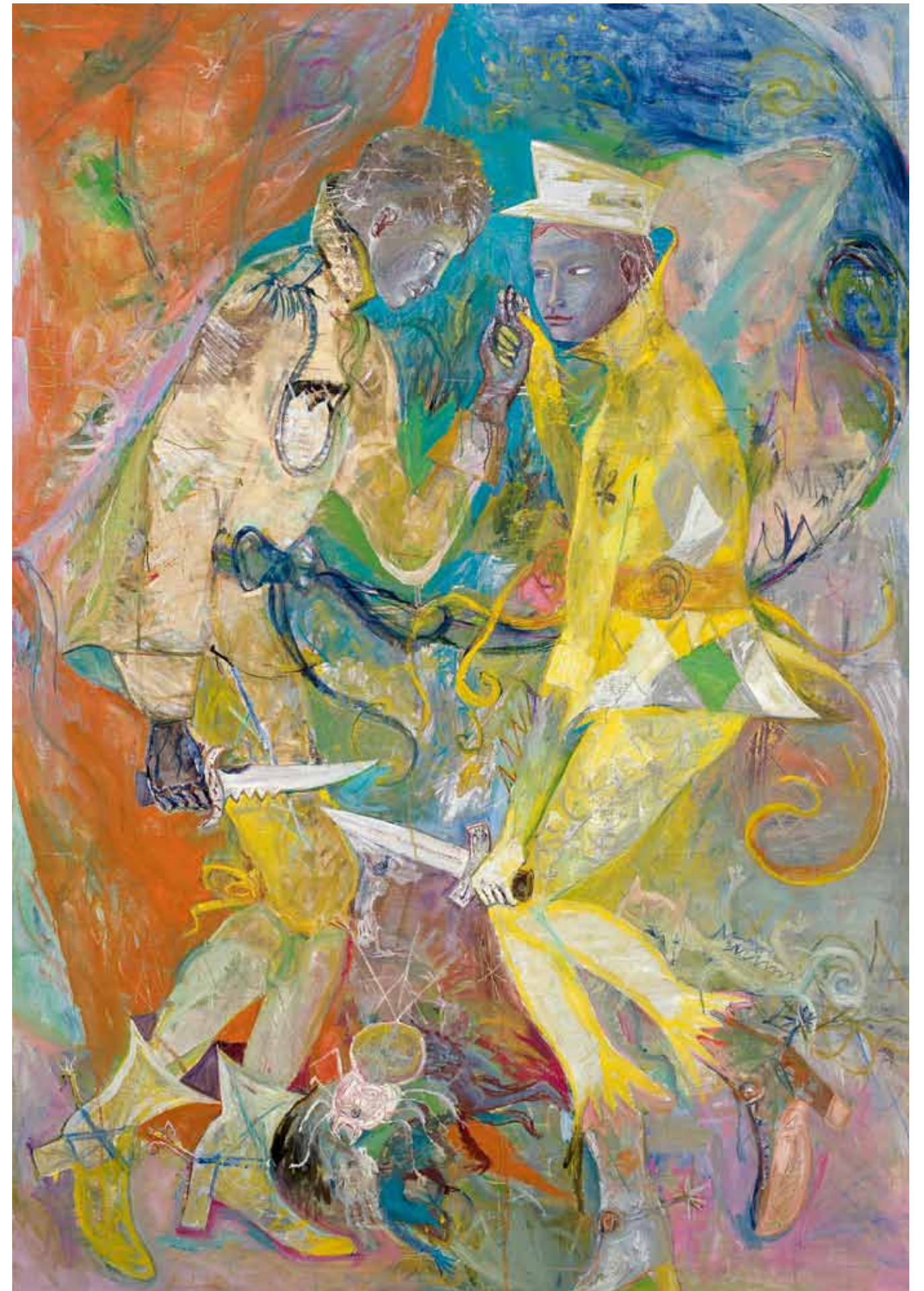
2525, 2007 Öl & Kunstharz auf Leinwand/ Oil & resin on canvas 250 x 175 cm / 98.4 x 68.9"