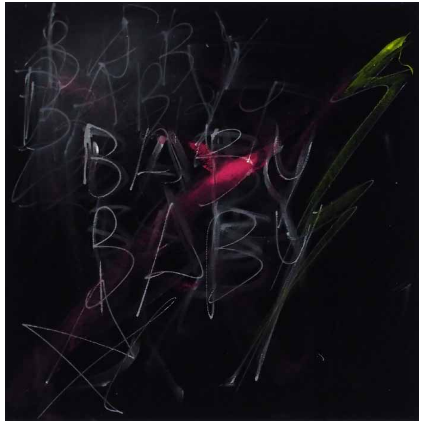
Baby Baby Baby Baby, 2013 Tusche & Acryl auf Samt/ Ink & acrylic on velvet 50 x 50 cm / 19.7 x 19.7"