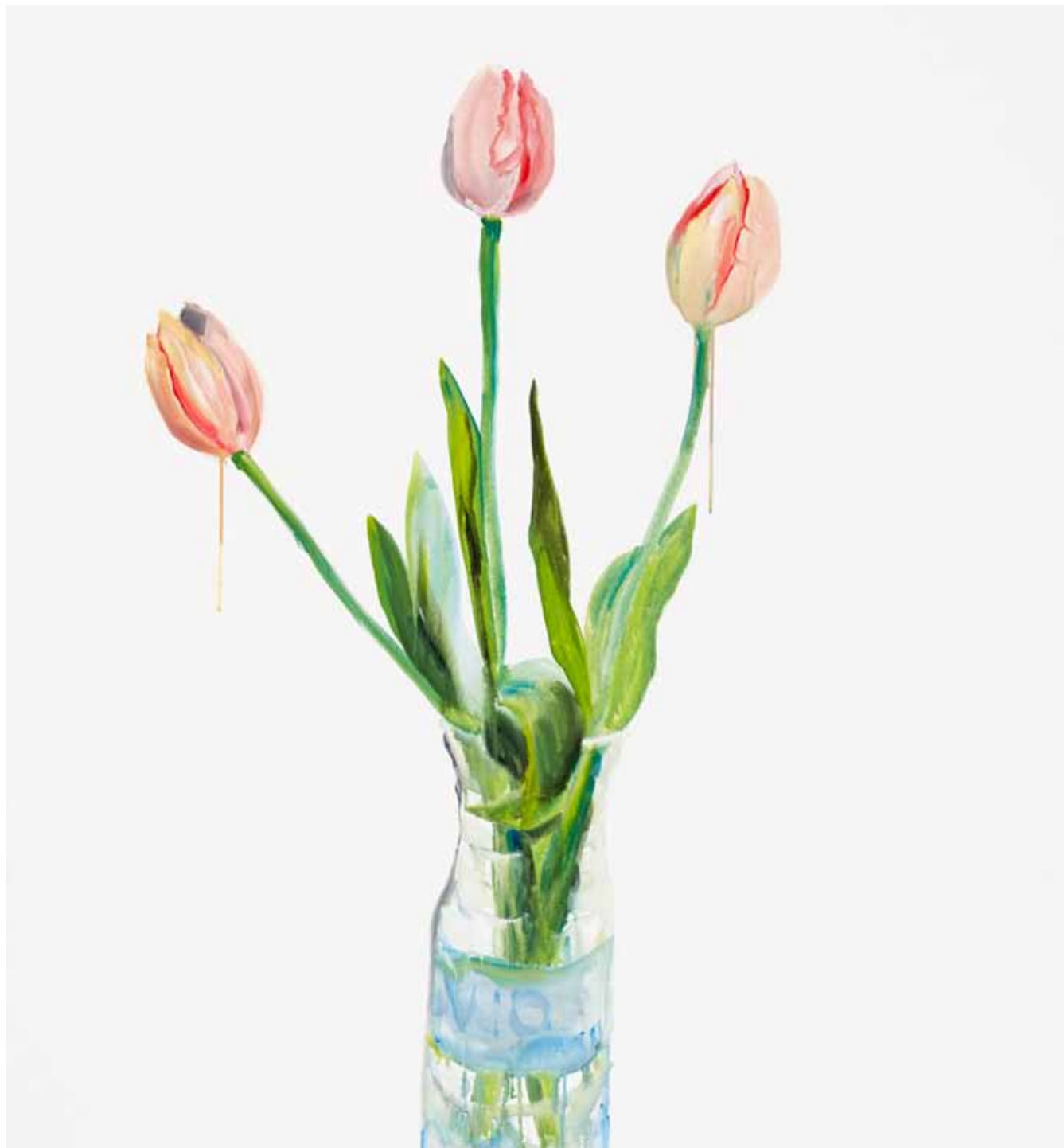
Violence, 2014 Eitempera auf Leinwand / Egg tempera on canvas 130 x 120 cm / 51.2 x 47.2"