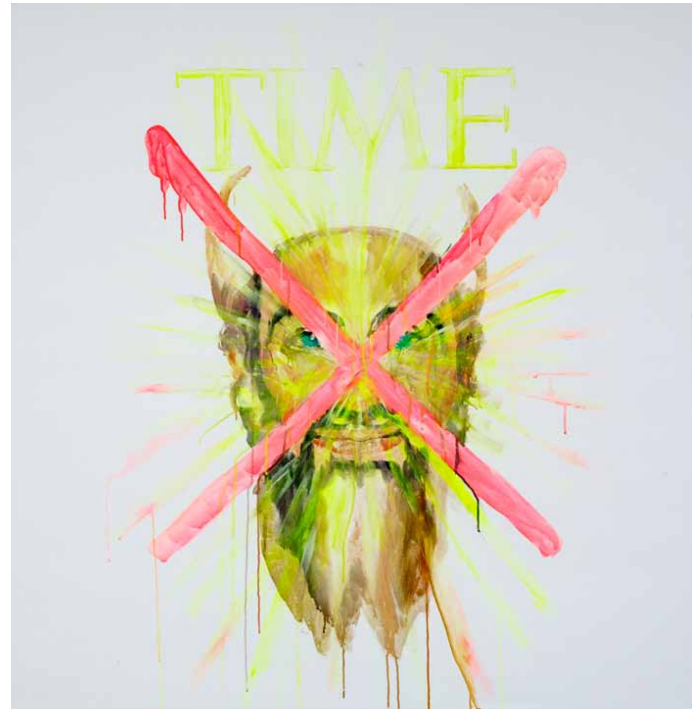
Sonne, 2012 Eitempera & Acryl auf Leinwand/ Egg tempera & acrylic on canvas 140 x 135 cm / 55.1 x 53.1"